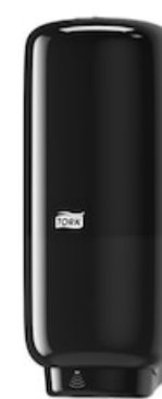
Tork Soap-Sanit Disp – Int Sens, bl 561608