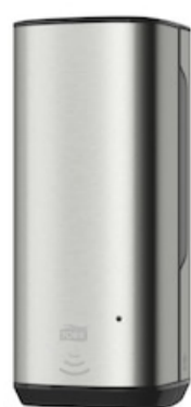
Tork Soap-Sanit Disp – Int Sens, SS 460009