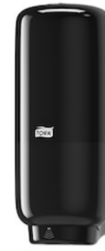
Tork Soap-Sanit Disp – Int Sens, bl 561608