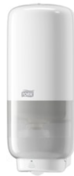
TorkS4DispSensor Sap e Disin Foam bianco 561600