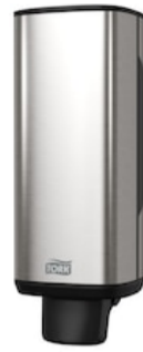
Tork Skincare Dispenser 460010