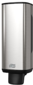
Tork S4 Disp sapone Image Design 460010