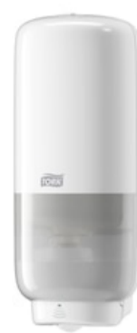
Tork Soap-Sanit Disp – Int Sens, wh 561600