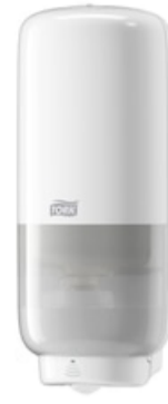
Tork Soap-Sanit Disp – Int Sens, wh 561600