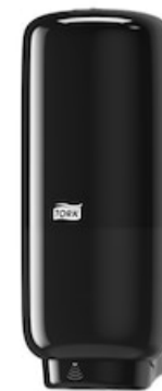
Tork S4 Disp sensor Sap. Foam 1 lt nero 561608