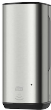
Tork S4 Disp Sap e Disin Sensor ImageDes 460009